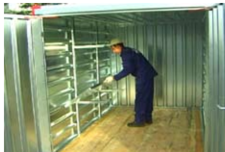
Weitere Regalstützen einbauen.