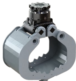
A09HPX 6 - 9 TONNEN

Dienstgewicht Trägergerät: 3,000 - 6,000 kg