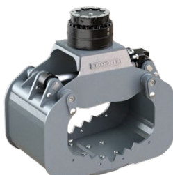
A06H 3 - 6 TONNEN

Dienstgewicht Trägergerät: 2,000 - 4,000 kg