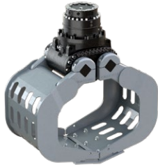
D06HPX 3 - 6 TONNEN

Dienstgewicht Trägergerät: 2,000 - 4,000 kg