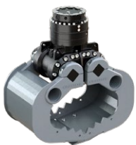
A04HPX 2 - 4 TONNEN

Dienstgewicht Trägergerät: 2,000 - 4,000 kg