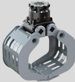
D09HPX 6 - 9 TONNEN

Dienstgewicht Trägergerät: 3,000 - 6,000 kg