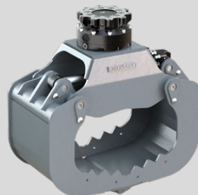
A09H 6 - 9 TONNEN

Dienstgewicht Trägergerät: 3,000 - 6,000 kg