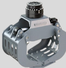
D06H 3 - 6 TONNEN

Dienstgewicht Trägergerät: 2,000 - 4,000 kg