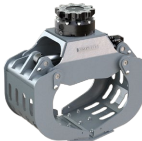
D09H 6 - 9 TONNEN

Dienstgewicht Trägergerät: 3,000 - 6,000 kg