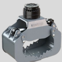
A04H 2 - 4 TONNEN

zurück zu www.kinshofer.com Abbruch- und Sortiergreifer bis 9t