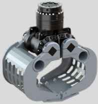
D04HPX 2 - 4 TONNEN

Dienstgewicht Trägergerät: 2,000 - 4,000 kg