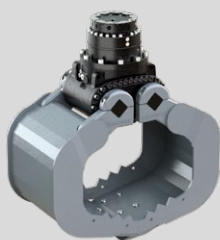
A06HPX 3 - 6 TONNEN

Dienstgewicht Trägergerät: 2,000 - 4,000 kg