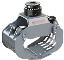
D04H 2 - 4 TONNEN

Dienstgewicht Trägergerät: 2,000 - 4,000 kg