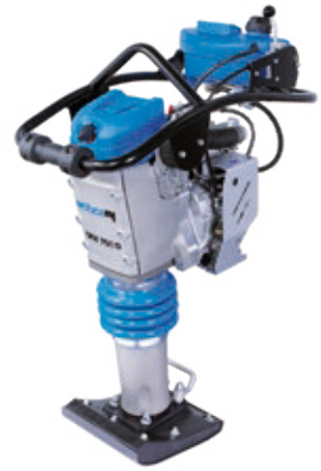
SRX 750 D

Zur Verdichtung unter beengten Platzverhältnissen und zum Unterstopfen von Leitungen und Rohren.