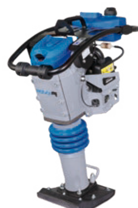
SRV 660 Hd